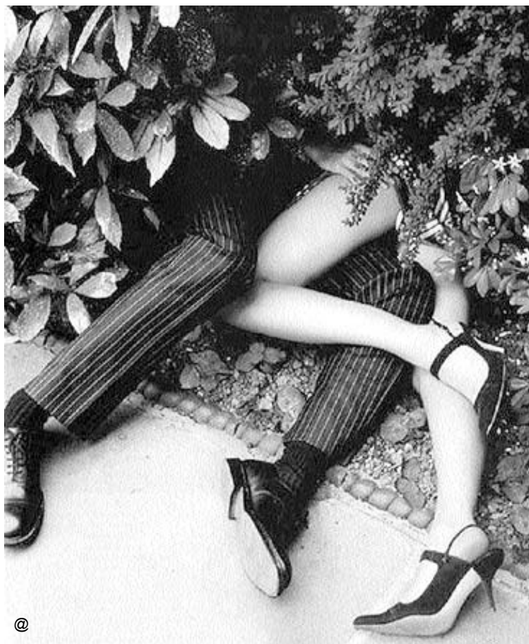
El príncipe Felipe y Letizia Ortiz estrechan relaciones en un descanso del Telediario.

que todavía se está reponiendo. El hecho no se consideró un atentado porque aún no se había endurecido la Ley Antiterrorista. No obstante, fueron despachados a empujones de la Zarzuela con orden de no volver bajo pena de exilio. Tras aquel episodio, la abuela paterna de Letizia, que estuvo presente durante el incidente, y que le había susurrado al Rey: «¿Qué buen suegro haría usted para mi nieta?», se convirtió en republicana militante y se puso a bordar banderas tricolores. Hace unos meses, cuando se enteró de que su nieta salía con Felipe montó en cólera y le mandó una carta en la que le amenazaba con partírla las piernas si la tocaba un pelo sin