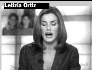
Letizia Ortiz LA ELIGIÓ PORQUE NUNCA SE NEGABA A UN BUEN VIAJE...